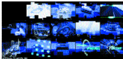
Televizní znělka pořadu Moto rama pro TV Markíza.