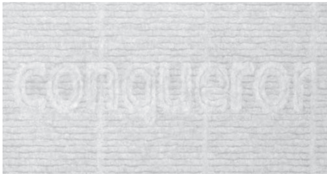
Fotografie prosvíceného bílého papíru s vodotiskem. Velikost 1:1, výřez z formátu A4.

Jako firemní papír se používá Conqueror Žebrovaný, barva DO Diamant (velmi bílá). Papír vyrábí společnost Ospap. Pro vizitky se doporučuje minimální gramáž 220 g/m 2 . Pro dopisní papíry se doporučuje gramáž 100 g/m 2 . Ražba papíru je orientována vodorovně, vodotiskové linky visle. Případný vodotiskový znak (nápis „Conqueror“ nebo znak) na šířku vystředit.