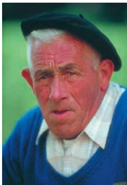
Francouzský vesničan – zdrojový obrázek byl vybrán kvůli vrásčité pleti.

Druhý nový nástroj dostal název Patch Tool (Záplata). Nástrojem, podobně jako Lasem, vyberete část obrazu, kterou chcete odstranit. Poté selekci přesunete do místa, kterým má být nahrazena. Photoshop volbu sám vhodně prolne a upraví jas tak, aby vše vypadalo co nejlépe.