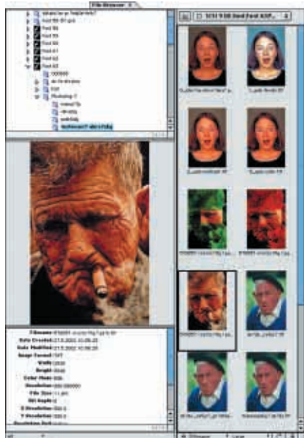
Dockovatelná paleta File Browser výrazně usnadní orientaci v souborech. O zvoleném obrázku je přehledně k dispozici celá řada užitečných informací.

Drobných zlepšení se dostalo automatizované funkci Contact Sheet a Web galeriím. Nová je funkce Picture Package, která podle zvolené šablony rozmístí danou fotografii na stránku volitelné velikosti a rozlišení. Photoshop 7 nově podporuje také formát XMP (Extensible Metadata Platform). Jedná se o nový formát Adobe, který přinese zlepšení workflow tak, aby mohl být jednotný obsah aplikován do tisku, na web, v elektronických knihách a dalších médiích. Klíčová slova, která přiřadíte obrázku ve Photoshopu, mohou být díky XMP například indexována internetovými vyhledávacími technologiemi.