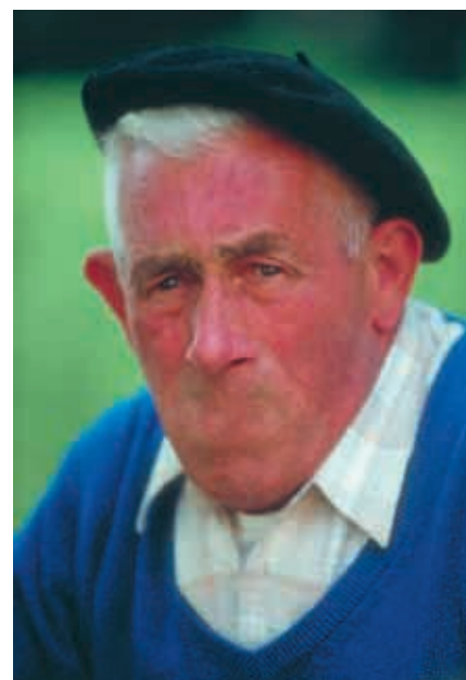
A takto „Matrixovský“ obrázek dopadne, když se ho s nástrojem Patch přežene... (pusa bylo označena nástrojem Patch a přetažena do plochy čela).