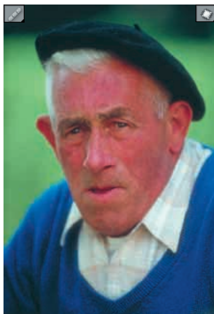
Pro vyhlazení obličejů byl použit nástroj Healing Brush. Tato retuž zabrala zhruba pět minut. Výšivka na svetry byla odstraněna pomocí nástroje Patch.