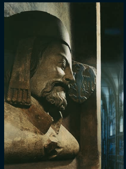
Fotografie vlevo (shora): Jan Štursa – Toaleta; František Bílek – Ukřižovaný; České korunovační klenoty, v pozadí originál votivní desky Jana Očka z Vlašimi (deska přenesena k fotografování v dece do Svatováclavské kaple) – 50. léta; Petr Parléf – Triforium. Fotografie vpravo: Jan Mařatka – Polibek. Na protější straně je fotografův autopořtět.