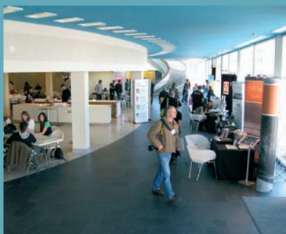
Přednáší s prezentačními stánky

V době digitální elektronické komunikace jsou design a hudba dva často propojované obory. Možná proto, že klasický design je z pohledu času statický a hudba naopak bez plynutí času neexistuje, je vzájemně propojování těchto oborů tolik lákavé.